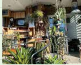
▼天井に飾られたドライフラワー ▼ポトス「グローバルグリーン」

「植物のある暮らしに憧れるけど、うまく育てる自信がない…」そんな方にこそおすすめしたい植物屋さん。 ヒミツは3つ! ①仕入れの段階で、育てやすい植物をピックアップ②水捌けの良い、上質な土に全品植え替え済③購入後はLINEで無料相談OK。買ってきてそのまま家に置くだけで、おしゃれに見えて元気に育てられます。 2024年2月にリニューアルして、生花を扱うDOORS-florist natural-が同建物内にオープンしました!