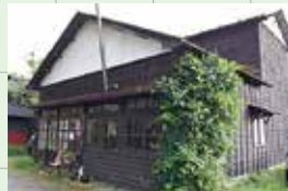
▲古民家のお店は懐かしい雰囲気とお花がマッチした癒しの空間

【小野装花店】 秋田市旭南1丁目6-2 TEL/080-5575-4312 定休日/不定休(SNSをチェック) 営業時間/10:00-17:00(レンタルスペースは応相談) 駐車場/店舗前3台 mail/onosoukatenn@gmail.com