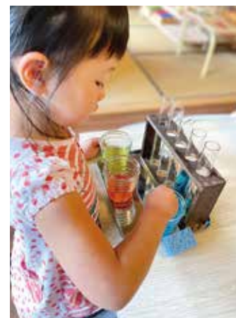
モンテッソーリ教育独自の教材や環境で五感をフルに活用