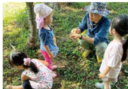
令和6年からは、森のようちえん活動もスタート

青柳 そうなんです。私たち夫婦は、7年前秋田に移住しました。私は東京出身で、夫は岩手県出身。私は、旅行が好きで、これまで40カ国以上の国を旅してきました。システムエンジニアをしていた夫とは、東京で出会って結婚したんです。