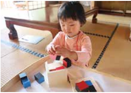
自分で選んだ活動に自主的に取り組みます