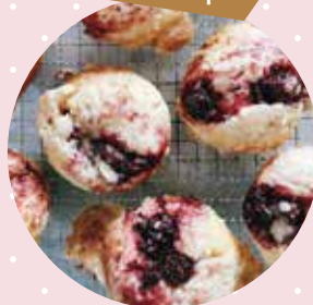
● スコーンとチーズケーキ

秋田市八橋三和町12-2 TEL / 018-862-6232 営業時間 / 平日 9:00~18:30 日・祝日 9:00~18:00 定休日 / 火曜 駐車場 / あり(6台) メール / nikori@purple.plala.or.jp HP / https://www.nikori-a.com/