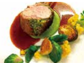
「Sous-sus」の一皿。仔牛のロースト、ハーブと共に…。