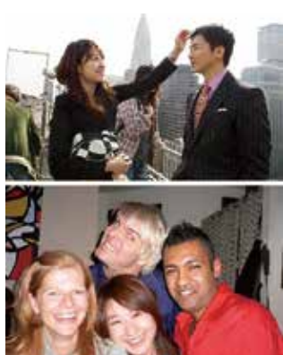
ニューヨークでの撮影の一コマと、同僚たちとの一枚