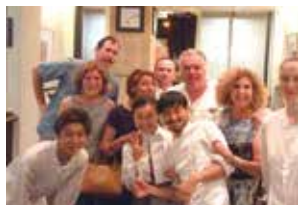
2015年パリのレストラン「ドミニク・ブシェ」の研修最終日