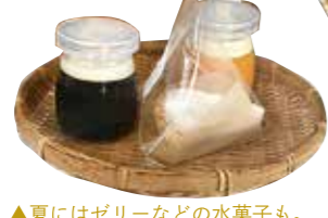
▲夏にはゼリーなどの水菓子も。ゼラチンではなく植物性の寒天を使