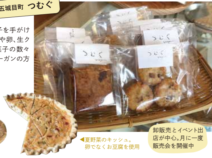
▲夏野菜のキッシュ。卵でなく豆腐を使用