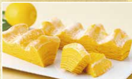
レモン香るマウントバーム

まるでバームクーヘンのカステラ。たまごたっぷり、 ふっくらジューシーな美味しさです。