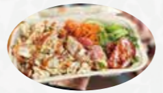
▲ローストチキン屋のオーバーライス

絶品のチキンが最高！古民家レストラン&キッチンカー 看板メニューの「ローストチキン」は迫力満点で肉汁溢れるジューシーな味わい。普段のお食事やお祝いのテーブルを華やかにしてくれます。食材にこだわった料理と朝市やマルシェの開催で、オープン2年目にして地域の人気店になりました。ランチはカレーやガバオライス、ルーロー飯など週ごとに変わるのでSNSをチェック！キッチンカーでは沖縄そばやチキンのオーバーライスを提供。県内各地で出店しているのでぜひお立ち寄りください。