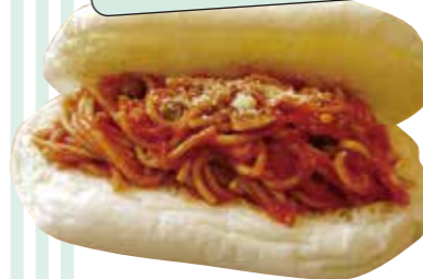
▲昔懐かしいナポリタンレギュラーサイズ330円

白くてふわふわのパンにたっぷりのフィリングを挟んだコッペパンは、いかが？店頭にはさまざまな種類の「おやつこっぺ」と「お惣菜こっぺ」が並びます。あんや自家製ホイップクリームなどのトッピング(有料)を追加して、お好みに合ったオリジナルのパンをつくってもらうこともできます！