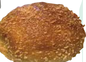
▲甘辛焼きカレーパン180円