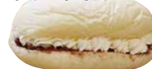
▲ハチトニあんホイップレギュラーサイズ230円

白くてふわふわのパンにたっぷりのフィリングを挟んだコッペパンは、いかが？店頭にはさまざまな種類の「おやつこっぺ」と「お惣菜こっぺ」が並びます。あんや自家製ホイップクリームなどのトッピング(有料)を追加して、お好みに合ったオリジナルのパンをつくってもらうこともできます！