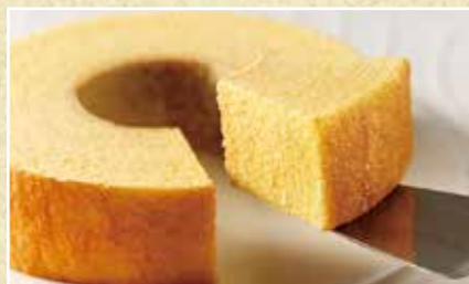
ストレートバーム

まるでバームクーヘンのカステラ。たまごたっぷり、 ふっくらジューシーな美味しさです。